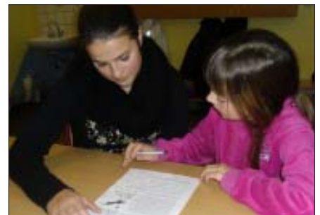
„Schüler helfen Schülern“ bei den Hausaufgaben.

Schüler sind zuverlässig und engagiert. Sie gehen bei der Betreuung selbst durch keine „leichte Schule“. „Schüler helfen Schülern“ wurde im September 2007 von der Stadt Aachen mit dem Prädikat „Familienfreundlich“ ausgezeichnet.